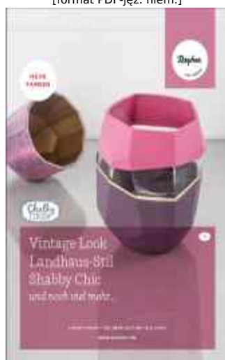
Pobierz ulotkę [format PDF-jęz. ang.]